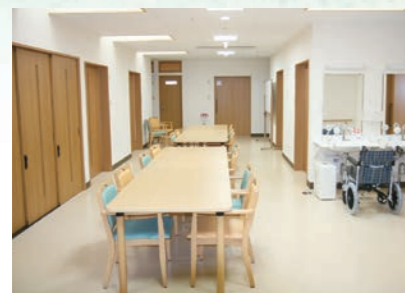
「通い」で来られた時のリビング、楽しい談話がはずみます。