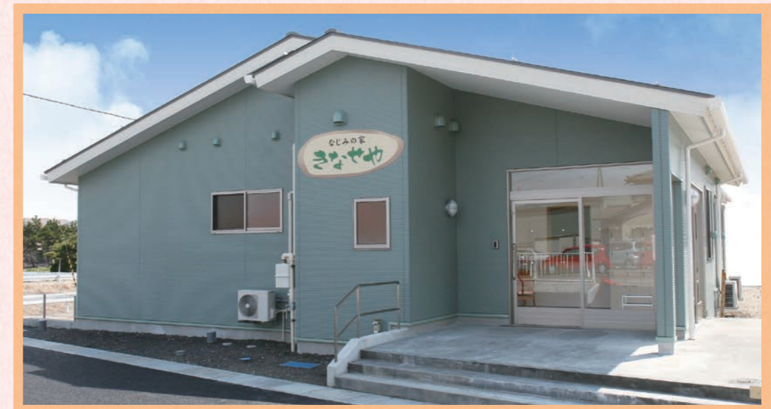
街なかの住宅地にあります。