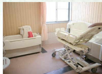
体の不自由な人も楽に入浴できます。