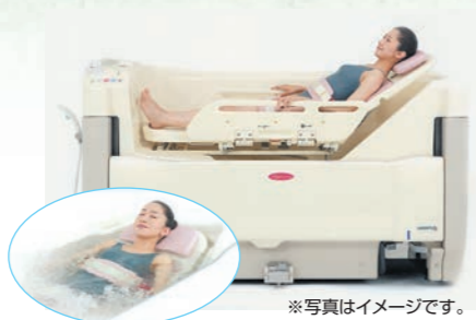
※写真はイメージです。 100%新湯方式で清潔、爽快に入浴できます。大型サイドフェンスで安全・安心です。肌触りの良い熱圧成型マットで快適です。