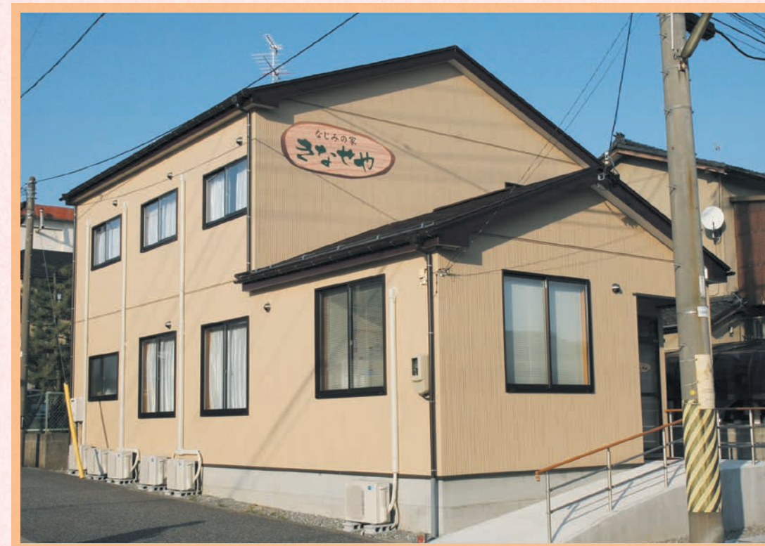
街なかの住宅地にあります。