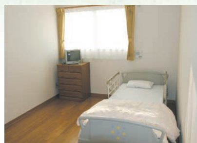
「泊まり」で来られた時の個室、プライバシーが 保たれます。