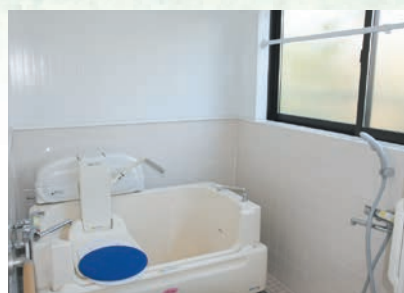
体の不自由な人も楽に入浴できます。