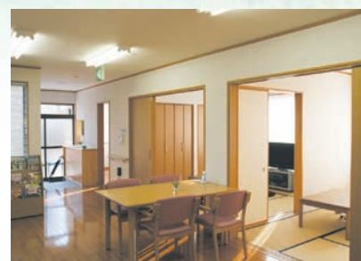
「通い」で来られた時のリビング、楽しい談話が はずみです。