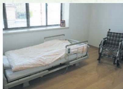
「泊まり」で来られた時の個室、プライバシーが保たれます。