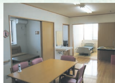
「通い」で来られた時のリビング、楽しい談話がはずみます。