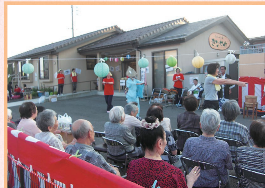
街なかの住宅地にあります。