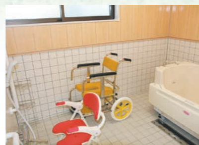
体の不自由な人も楽に入浴できます。