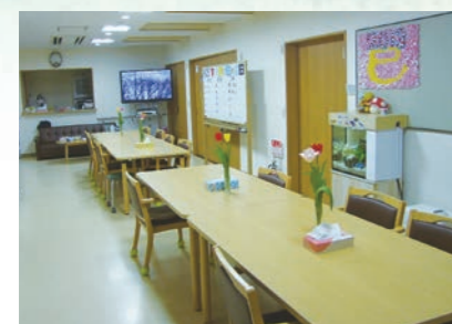
「通い」で来られた時のリビング、楽しい談話がはずみます。