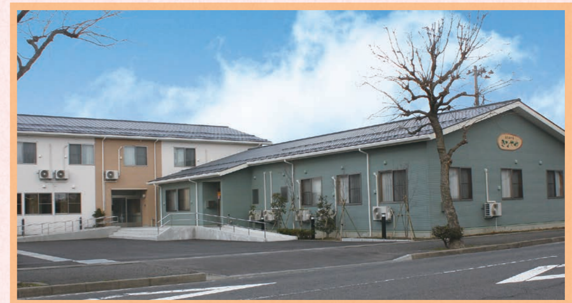
街なかの住宅地にあります。