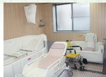
体の不自由な人も楽に入浴できます。