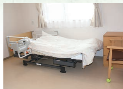
手元スイッチで、背や膝の角度とベッドの高さが自由に操作できます。運転音の静かな3モーター式介護ベッド。