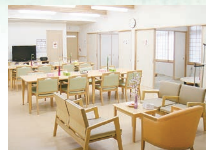
「通い」で来られた時のリビング、楽しい談話がはずみます。