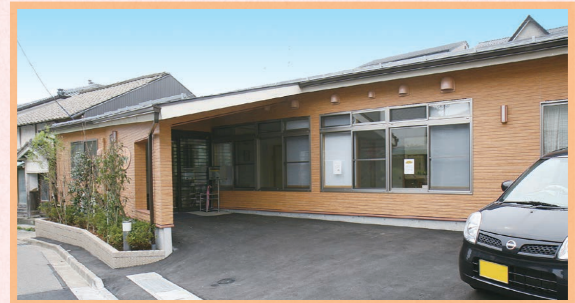
街なかの住宅地にあります。