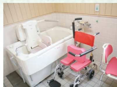
体の不自由な人も楽に入浴できます。