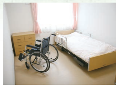
「泊まり」で来られた時の個室、プライバシーが保たれます。