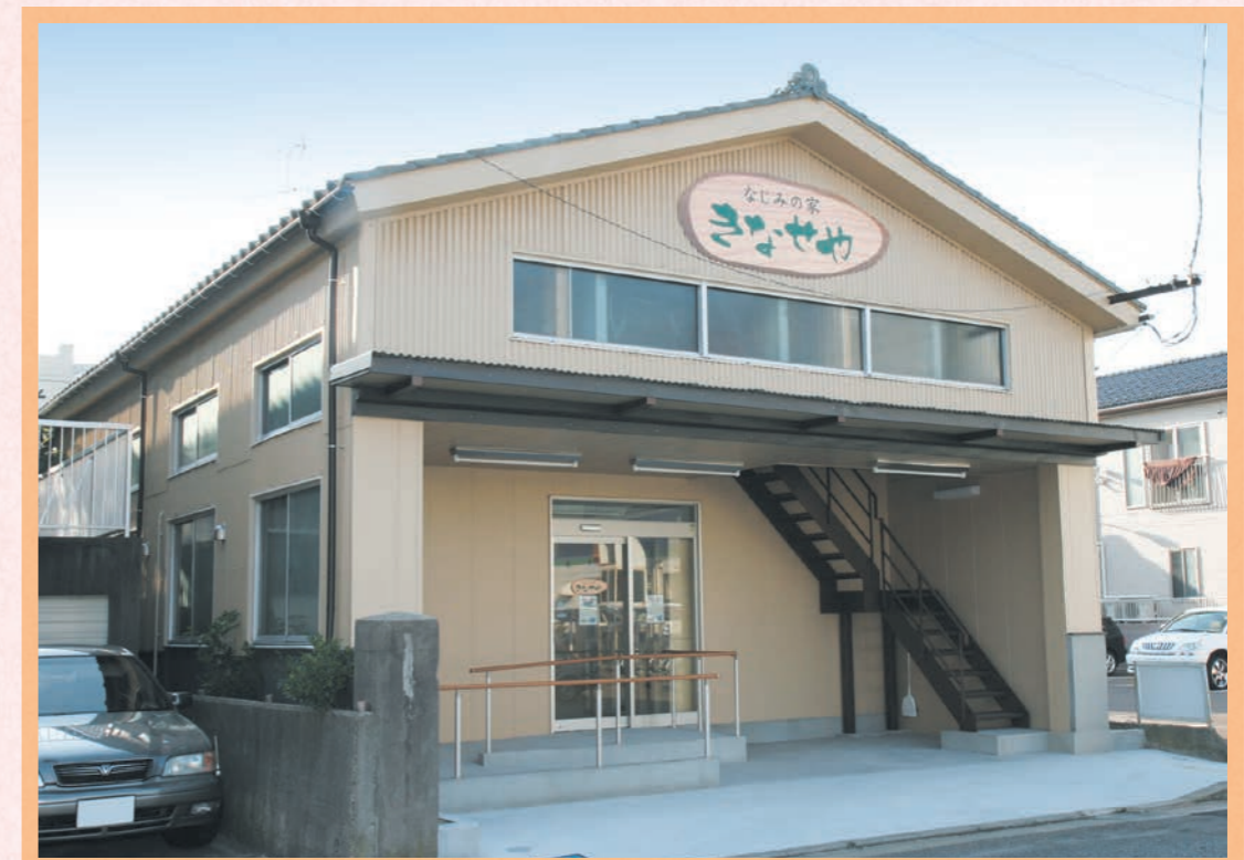
街なかの住宅地にあります。