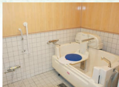
体の不自由な人も楽に入浴できます。