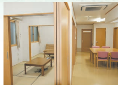
「通い」で来られた時のリビング、楽しい談話がはずみます。