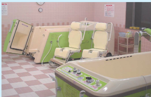
▲入浴時の身体へのご負担を軽減する特殊浴